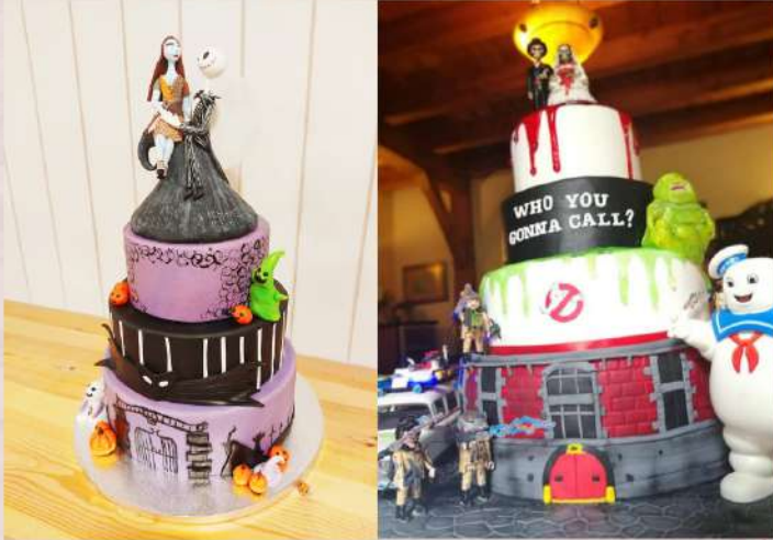
Tarta a medida