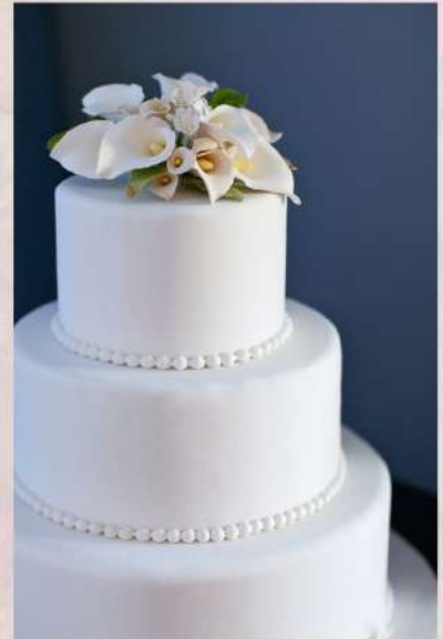
Tarta nº4 - Corona flores fondant Tarta coronada por flores en azúcar

En este caso podemos escoger el color de las flores y combinarlo con el lazo de cada planta. Las flores se realizan con pasta de azúcar, a elegir entre rosas o calas.