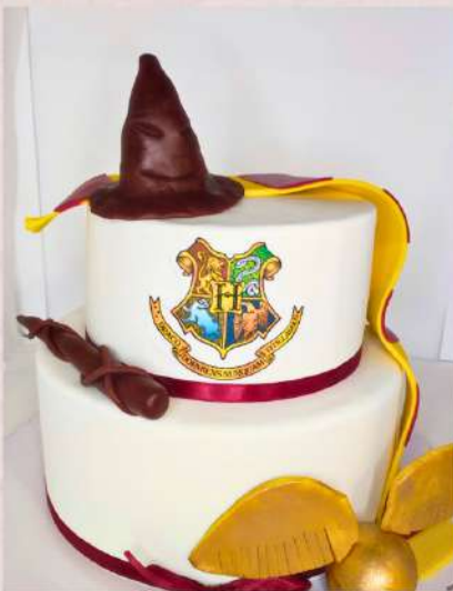
Tarta nº9 - Temática

Tarta con posibilidad de poner 3 detalles representativos y sencillos de la temática que se quiera.