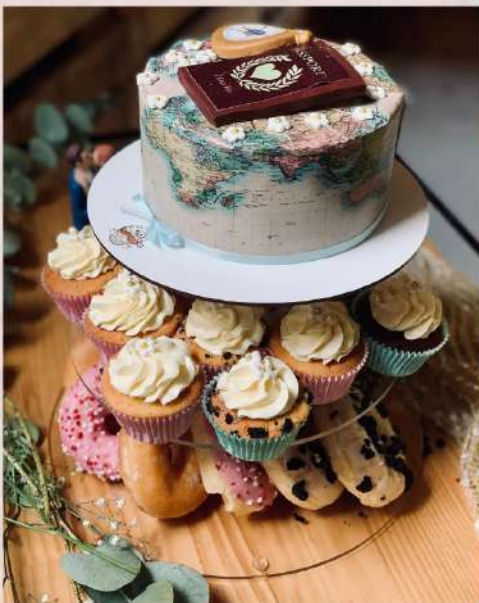
Stand con tarta de corte y bollería individual

Raciones cortadas listas para emplatar A elegir entre una amplia gama de combinaciones de sabores