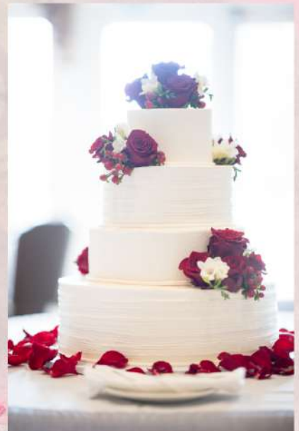
Tarta nº10 - Tarta con un piso extra falso

*Opción de hacer más detalles o figuras, en la sección "tartas a medida". Precio más elevado