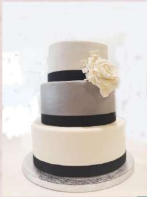
Tarta nº5 - Piso con textura

Podemos meter algo de color o textura en uno de los pisos