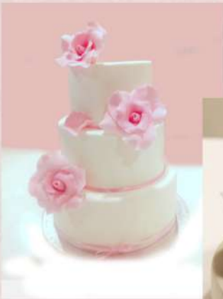
Tarta nº3 - Flores en fondant